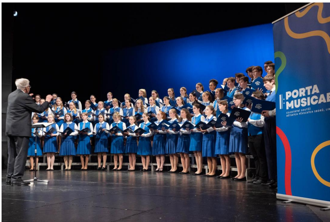
Zahajovací koncert festivalu Porta Musicae (Liberec)