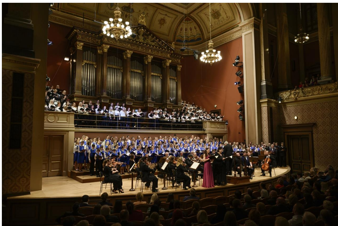
Velký vánoční koncert (Rudolfinum)