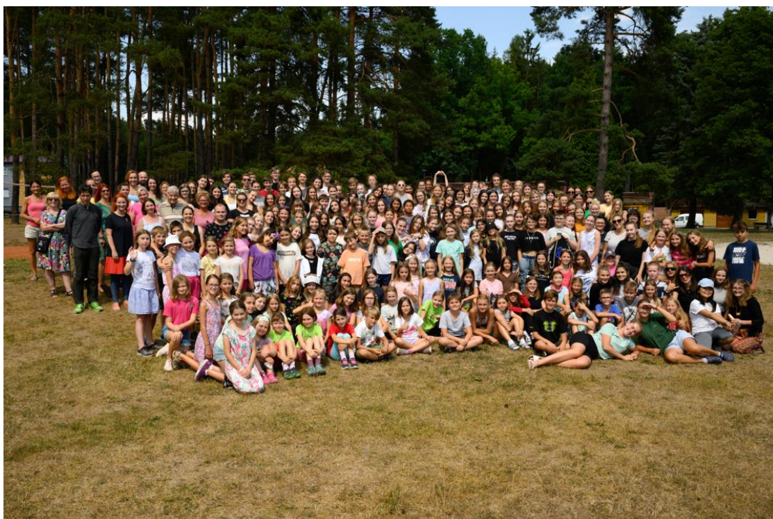
Letní umělecké soustředění (Žihle)