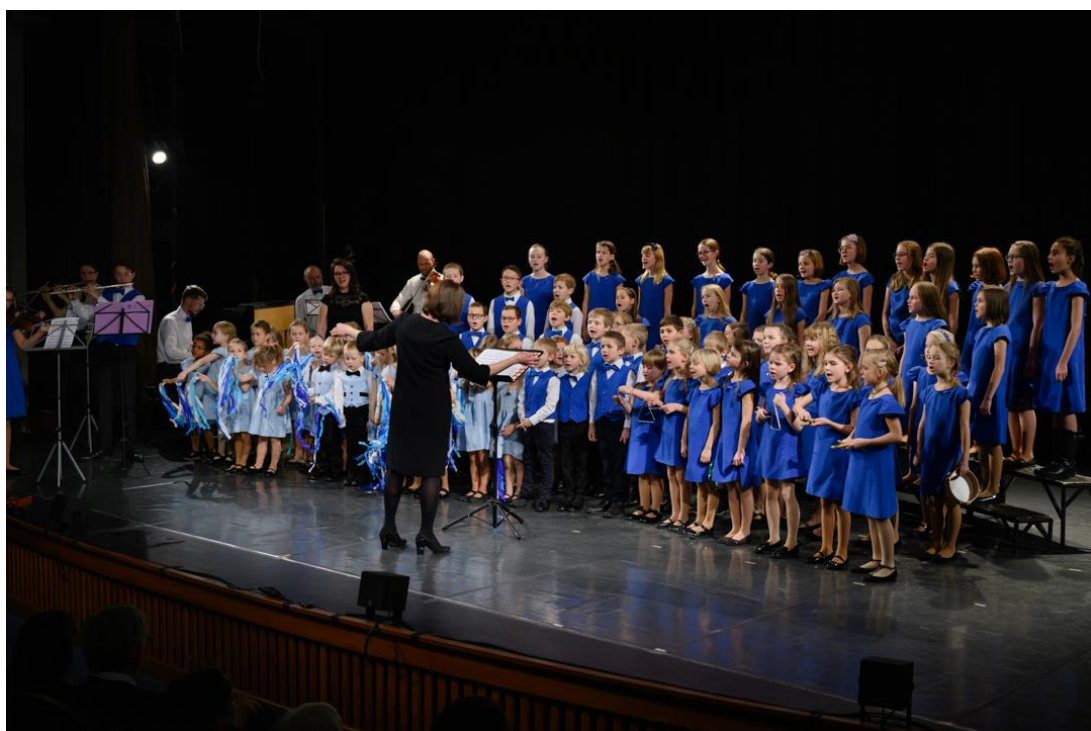
Vánoční koncert (Městská knihovna Praha)