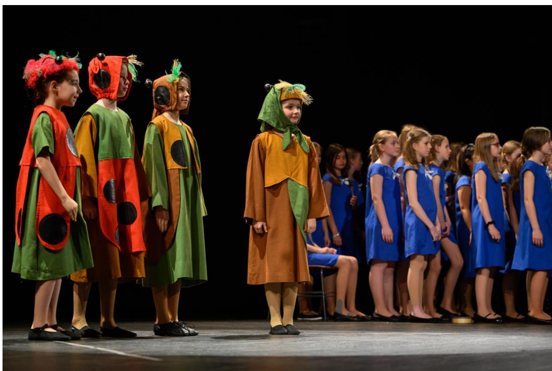
Jarní koncert (Městská knihovna Praha)