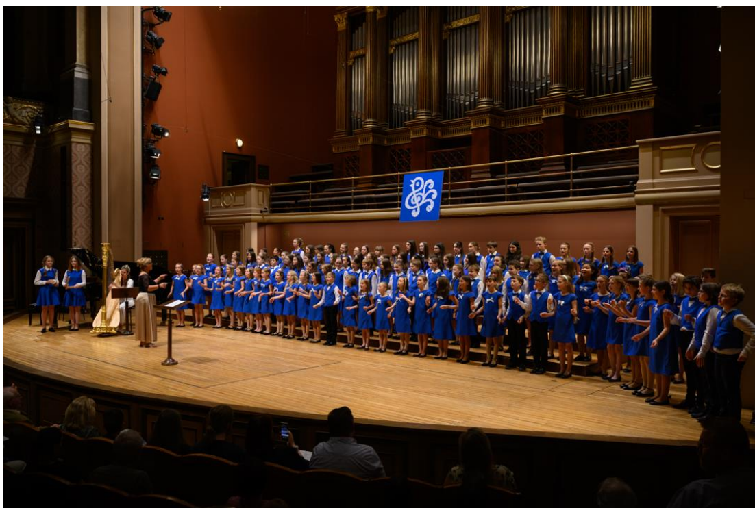
Závěrečný koncert (Rudolfinum)