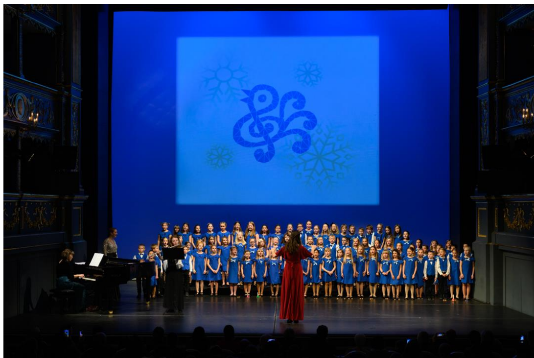
Vánoční koncert (Stavovské divadlo)