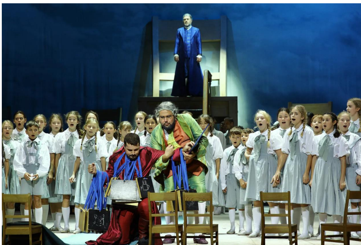
Jakobín (Národní divadlo)