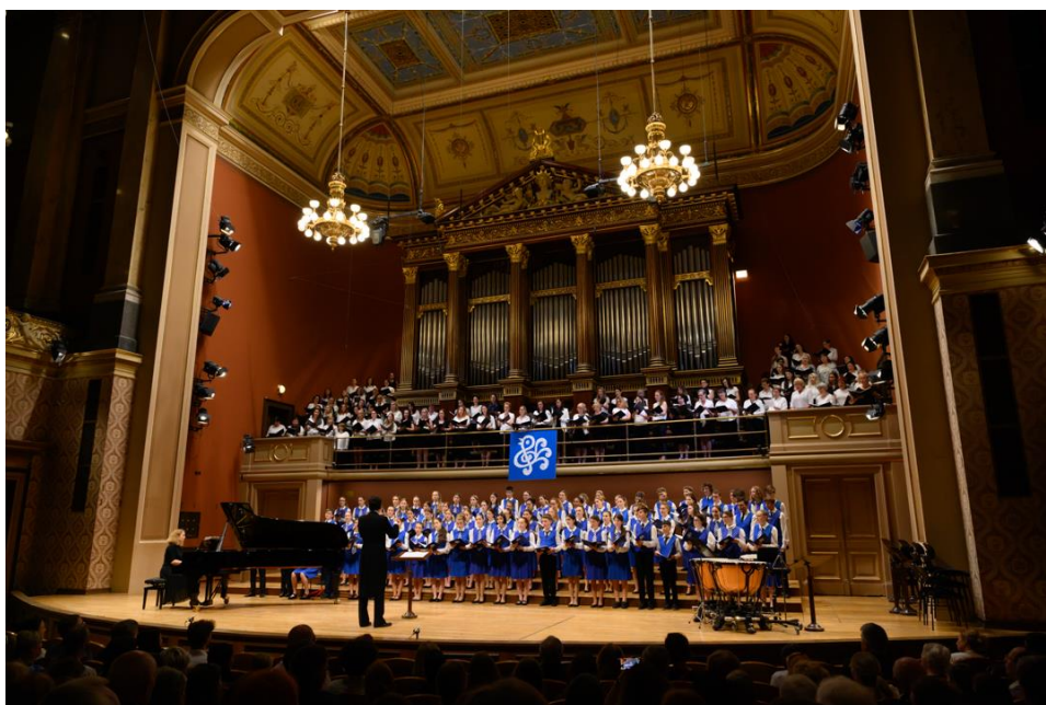
Velký jarní koncert (Rudolfinum)