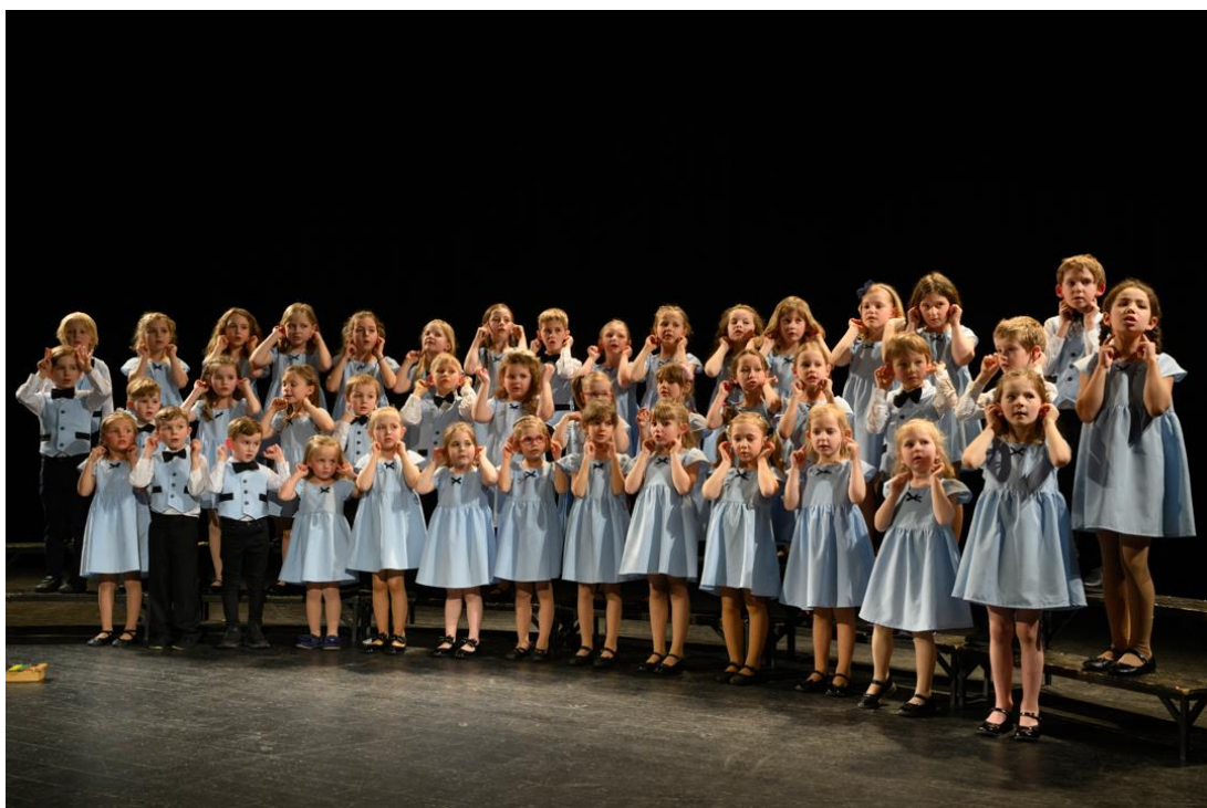
Jarní koncert (Městská knihovna Praha)