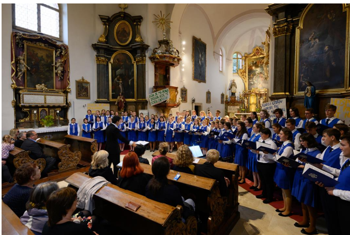
Koncert v Manětíně